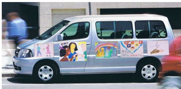
von der Seite

Achtung jedes Lebens Ablehnung von Gewalt Mit anderen teilen Zuhören und Verstehen Erhaltung der Erde Solidarität