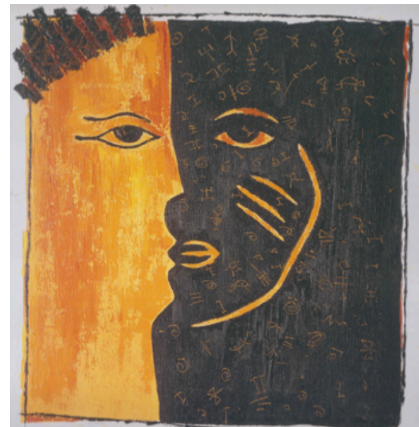
„We Are One“

Die Ausstellung wurde realisiert vom Verein CNP Creative Network of Peace, zu seinem 10 jährigen Bestehen gemeinsam mit der Regio Galerie Basel+ Grenzach die 2010 ihr 20 jähriges Jubiläum feiern kann.